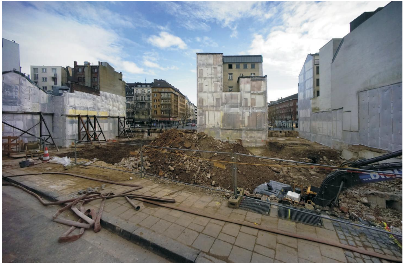
Gegenüber dem Stadttheater (Aachen abseits der Postkarten)

informelle Treffs ca. 14-tägig montags in den Sommerferien 20h, Ort wird noch bekanntgegeben