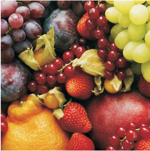
Obstkorb (Frucht und Früchtchen)