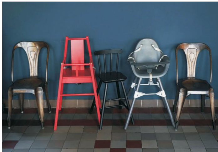
Platzreserve, Schaarbeek B (Vierbeiner)